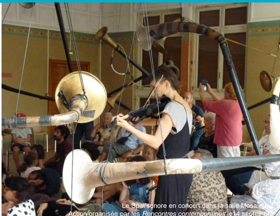
Le Spat'sonore en concert dans la salle Mosaïques. Action organisée par les Rencontres contemporaines le 14 septembre.

Et, en attendant des lendemains plus chantants, inventons un présent intérieur vivant et préparons-nous à des jours meilleurs, pour la vie sociale et notre désir de partage.