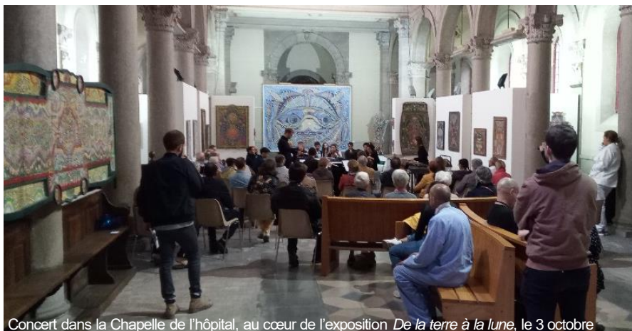
Concert dans la Chapelle de l'hôpital, au cœur de l'exposition De la terre à la lune , le 3 octobre